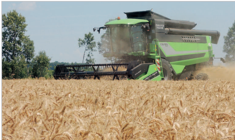
Deutz-Fahr nabízí pro sklízecí mlátičky řady C6000 čtyři standardní žací lišty s pevným stolem a tři lišty Variocrop

V neposlední řadě byl při konstrukci nové řady brán zřetel i na co nejsnadnější údržbu. Snadný přístup ke všem bodům údržby zajišťují velké výklopné boční panely a pro Deutz-Fahr typické oddělení hydraulických a mechanických pohonů. Zásadně byl přepracován i motorový prostor, který i v této kompaktní třídě umožňuje volný přístup k motoru. Přepracováno bylo sání vzduchu, které nyní nevyžaduje každodenní čištění, ale pouze jednou za tři dny. Celou údržbu je i díky srovnatelnému údržbovému plá-