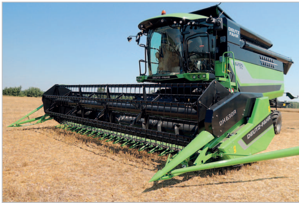
Nové sklízecí mlátičky C6000 doplňují modernizovaný sortiment Deutz-Fahr

Jednou z hlavních inovací u řady C6000 je pohonná jednotka a celé uspořádání motorového prostoru a chlazení. Požadavek na stále vyšší výkon a přitom potřeba plnění neustále se zpřísňují-