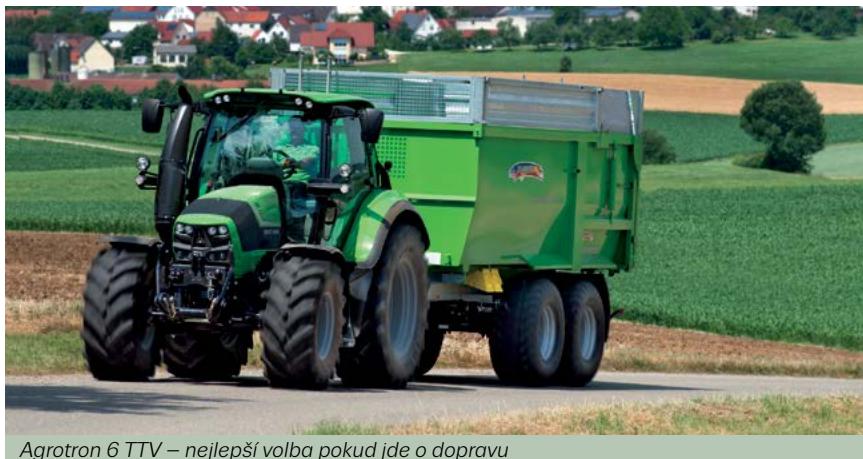
Agrotron 6 TTV – nejlepší volba pokud jde o dopravu

hydromechanickými převodovkami pod označením TTV. Tato ústrojí představují absolutní vrchol současné převodovkové technologie a zároveň nejlepší volbu účinného a přitom plynulého přenosu výkonu motoru na kola. O výrobu těchto převodovek se stará stejně jako o převodovky CShift renomovaný německý výrobce ZF Passau. Modely s plynulými převodovkami pod označením TTV lze pak ve spojení s nejmodernější