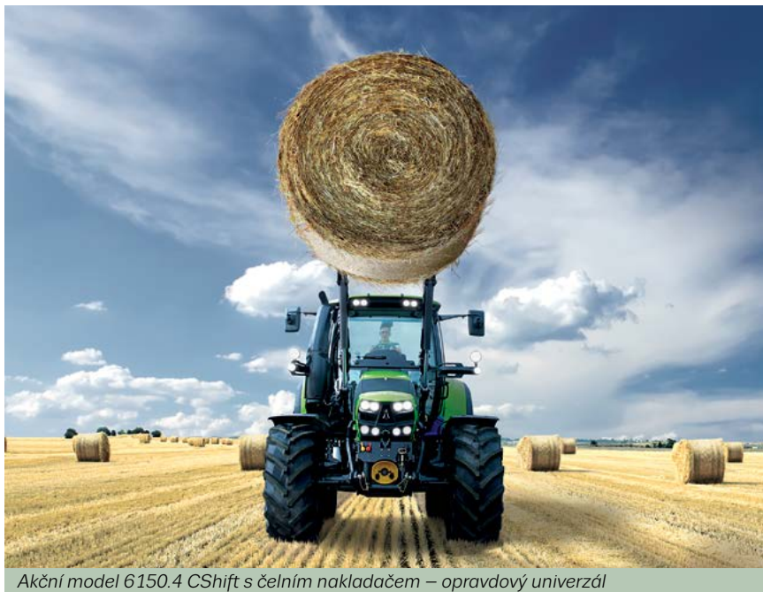
Akcí model 6150.4 CShift s čelním nakladačem – opravdový univerzál

Všechny modely řady 6 jsou dostupné i se špičkovými plynulými